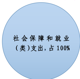
(图 6: 一般公共预算财政拨款支出决算结构)(饼状图)

2021 年一般公共预算财政拨款支出 428.5 万元，主要用于以下方面：一般公共服务（类）支出 0 万元，占 0%；教育支出（类）0 万元，占 0%；科学技术（类）支出 0 万元，占 0%；社会保障和就业（类）支出 428.5 万元，占 100%；医疗卫生支出 0 万元，占 0%；住房保障支出 0 万元，占 0%；